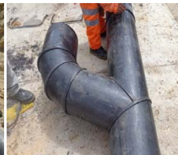
Fabricación de Accesorios de HDPE