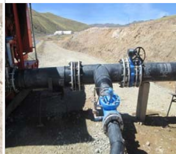
Instalación y Montaje de Válvulas