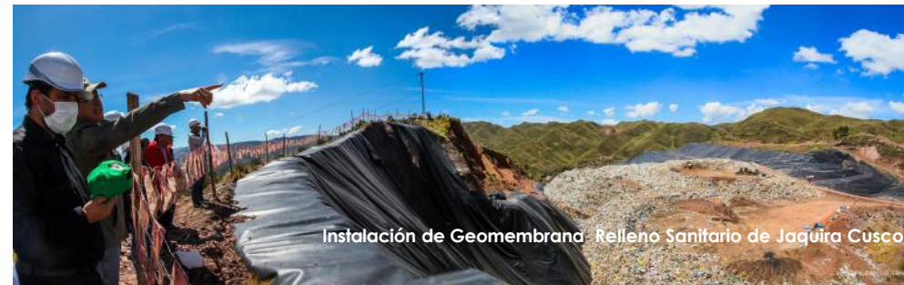
Instalación de Geomembrana: Relleno Sanitario de Jaquira Cusco