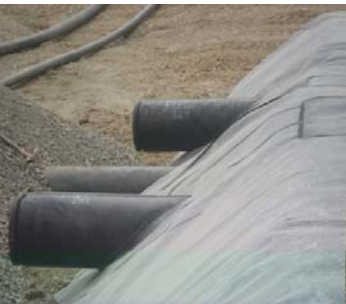
Fabricación de Botas de HDPE