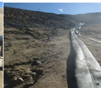
Fabricación de Mangas de Geomembrana para conducción de Fluidos