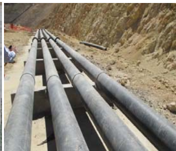
Instalación de Tuberías de HDPE Lisas