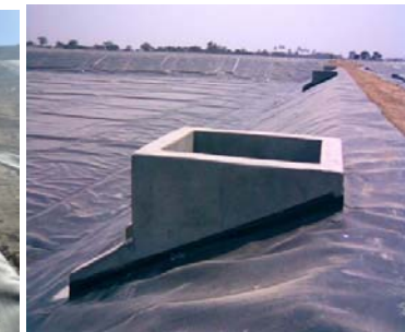
Impermeabilización de Estructuras de Concreto